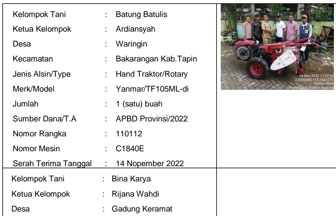
Tabel 3.2 Data dan Dokumentasi Serah Terima Hibah Alsintan APBD Provinsi Kalimantan Selatan

Selanjutnya juga membantu menyalurkan hibah dari sumber dana APBD Provinsi Kalimantan Selatan melalui Dinas TPH Provinsi Kalimantan Selatan ke Dinas Pertanian Kabupaten Tapin. Hibah tersebut berupa 5 unit Hand Traktor dan 3 unit Pompa Air Portable. Kesemuanya ditujukan kepada kelompok-kelompok tani yang berada di Kabupaten Tapin. Adapun daftar penerima hibah dari APBD Provinsi Kalimantan Selatan tersebut adalah sebagai berikut :